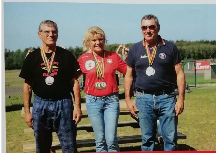
Le podium du Hit&Rock