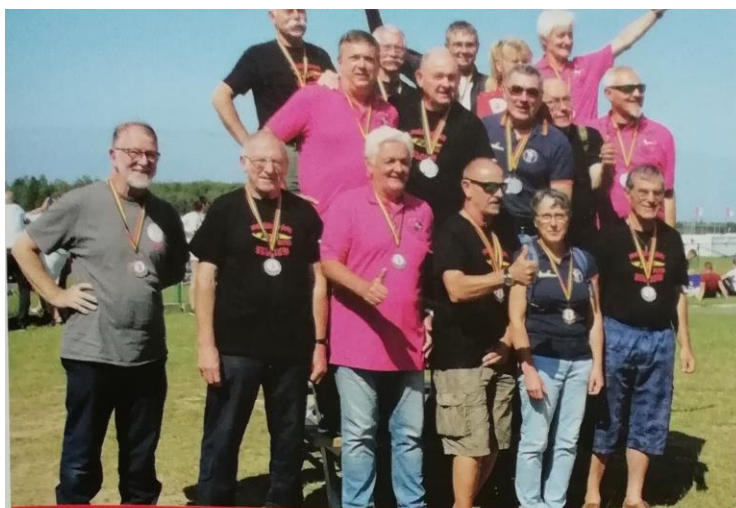
Le podium du VR-6 vitesse